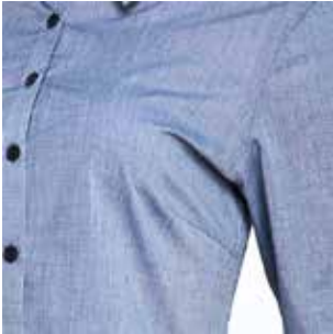
PINZAS EN BUSTO