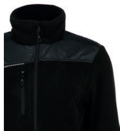
REFUERZO EN HOMBROS