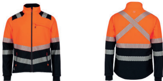
CINTAS REFLECTANTE 360°